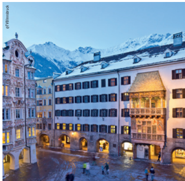
Kaiser Maximilian I. ließ das Goldene Dachl als Prunkerker um 1500 errichten

Die WELCOME TOUR ist ein kurzweiliger, informativer Rundgang, der Sie zu den wichtigsten Sehenswürdigkeiten der Altstadt führt. Die bewegte Geschichte Innsbrucks, geprägt vom habsburgischen Erbe, wird direkt und hautnah erlebbar. Hinweise zur modernen Architektur und praktische Tipps ergänzen das Programm.