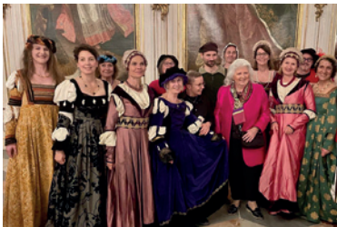
Ausstellungs-Eröffnung 2023: in Seusenhofers Werkstatt / Gruppenbild Per Pedes Guides

Am 20. April 2024 feiern wir von 14.00 – 18.00 h unser Firmenjubiläum: 30 Jahre Per Pedes Tirol!